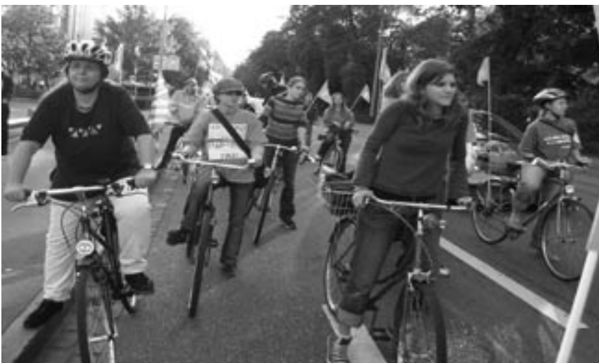
Der Velokonvoi am 22. September, dem Aktionsstag „Clever unterwegs“ wurde durch viele Autos gestaut. Ein weiterer Beweis für die Notwendigkeit solcher Aktionen.

Die Aussicht auf erweiterte Konsumfreiheit an Bahnhöfen und Flughäfen lässt eben auch Fragen aufkommen: Muss man sich am Bahnhof neben dem Buch und dem Weggli für die Reise im Zug wirklich auch einen Staubsauger oder ein Bett kaufen können? Ein konsumfreier Tag pro Woche, liegt nicht vielleicht auch darin eine gewisse Lebensqualität? Wie viel Geld haben die Leute überhaupt im Portemonnaie und wie oft können sie dieses ausgeben?“ Die negativen Punkte dieser Vorlage überwiegen die Vorteile bei weitem. Der Vorstand der Grünen Schweiz hat darum der Delegiertenversammlung - ohne Gegenstimme, aber mit einigen Enthaltungen - die Nein-Parole empfohlen. Der Vorstand der Grünen Basel-Stadt hat in einer Abstimmung geschlossen die NEIN-Parole zur Änderung des Arbeitsgesetzes beschlossen.