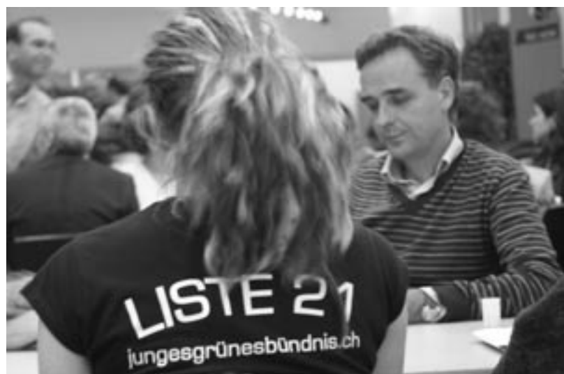
Regierungsrat Guy Morin zeigt dem Jungen Grünen Bündnis den Politikalltag in Form eines zeitüberbrückenden Jasses. Die Aufnahme wurde im Wahlforum vor der Verkündung der Wahlergebnisse gemacht.

Mehr Infos zum Jungen Grünen Bündnis bekommt ihr unter www.jungesgruenesbuendnis.ch