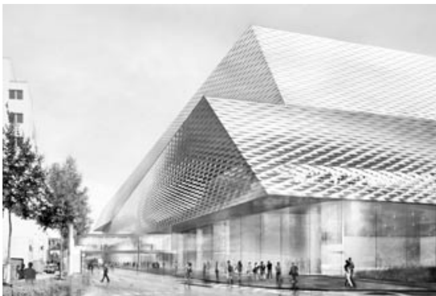
Das neue Messezentrum, wie es dereinst aussehen soll. Blick vom Kreisel Riehenring / Riehenstrasse Richtung Messeplatz.

Die Messefrage kommt periodisch auf den Tisch. Heute steht ein Erweiterungsbau für 2012 zur Diskussion. Die Grüne Partei BS hat sich in den zwanzig Jahren ihres Bestehens intensiv und profiliert mit der Entwicklung des Messestandorts Basel auseinandergesetzt. Für eine „Messe in der Stadt“, aber nach den modernsten ökologischen Standards, haben wir uns immer stark gemacht. Das Messezentrum Basel 2012 soll nun auch diese ökologischen Zielsetzungen erfüllen.